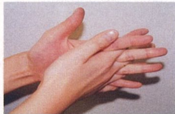
4. 指の間を十分に洗う