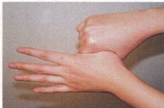
5. 親指と手掌をねじり洗いする