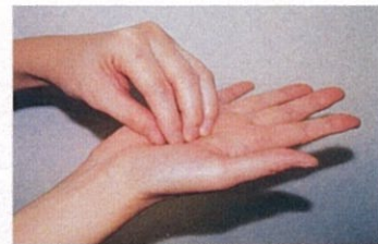
3. 指先、爪の間をよく洗う