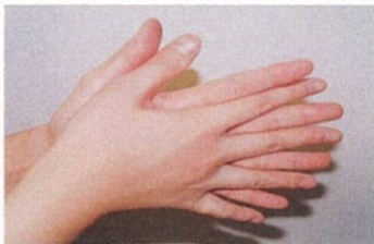
1. 手のひらを合わせ、よく洗う