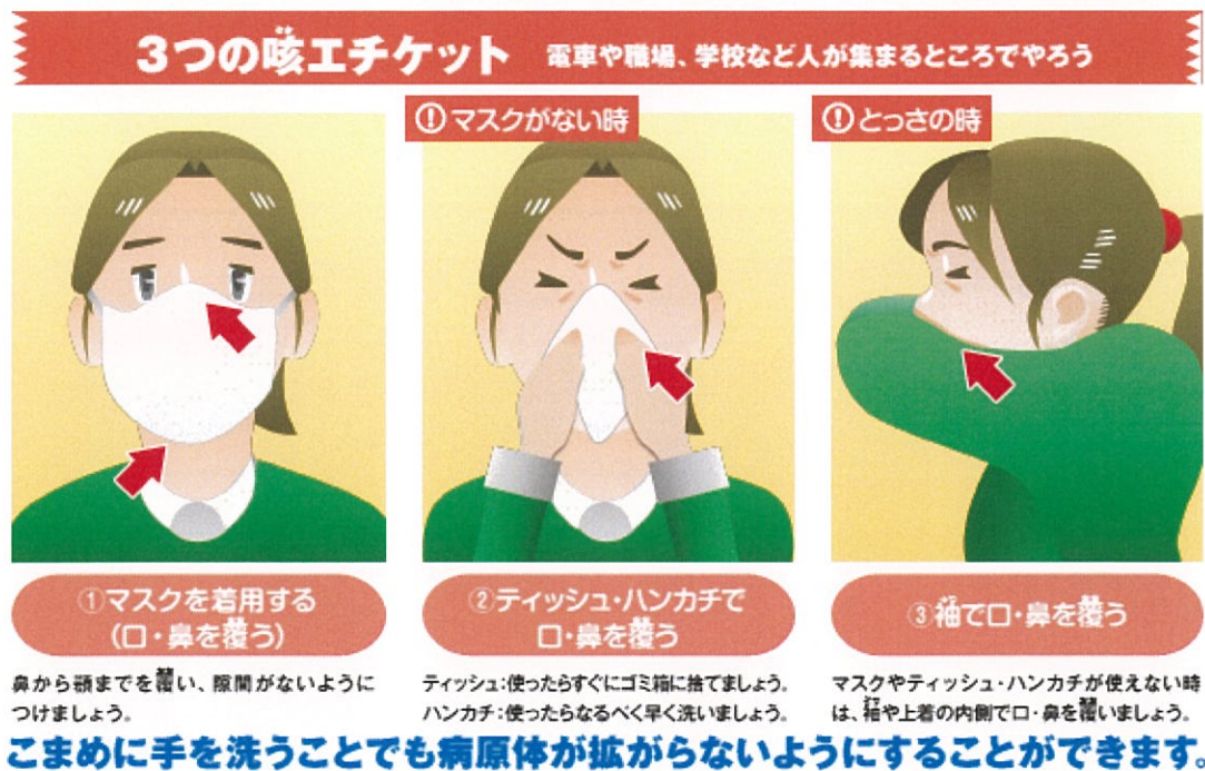
図3 咳エチケットについて