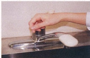
7. 水道の栓を止めるときは、手首か肘で止める。できないときは、ペーパータオルを使用して止める